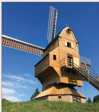
Moulin de Naours