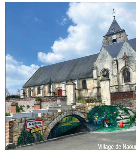
Village de Naours

• Comité Somme : https://somme.ffrandonnee.fr/