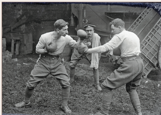
Vignacourt : arrière front

Ce circuit, les soldats l'ont parcouru pour visiter les grottes de Naours dans