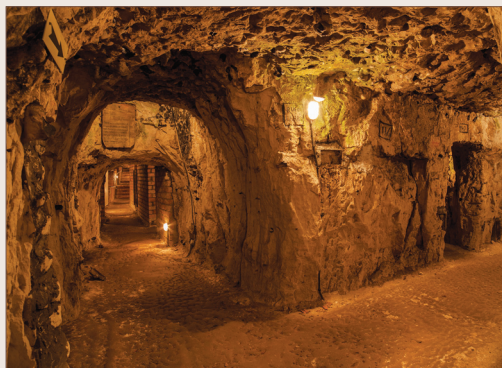
Cité souterraine de Naours